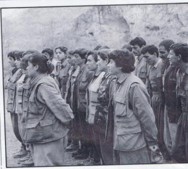
الوحيد عن هذه الأفكار ، فإن كثيرين يجمعون أيضاً على كون - pkk حزباً

لنسلم أولاً أن أفكار - pkk هي أفكار قانده عبد الله أوجلان الملقب بـ - أفكر - وقد تخلف في كونه ذهن الأفكار منذ عدا حاجات وتطلعات أكراد تركيا أو الأكراد ككل . كما يزعم أبو ، أو تتماشى مع مفكرات ومبررات الحياة السياسية في الثقافة والعمل والواقعية أو الحاسة أو مبدئية . إلا أنه بالاعتماد لكون أبو ، خارجاً الجميع ، المعبر الفصيح وبما لبناز أحداث ١٩٨٢ ، خصوصاً جرد